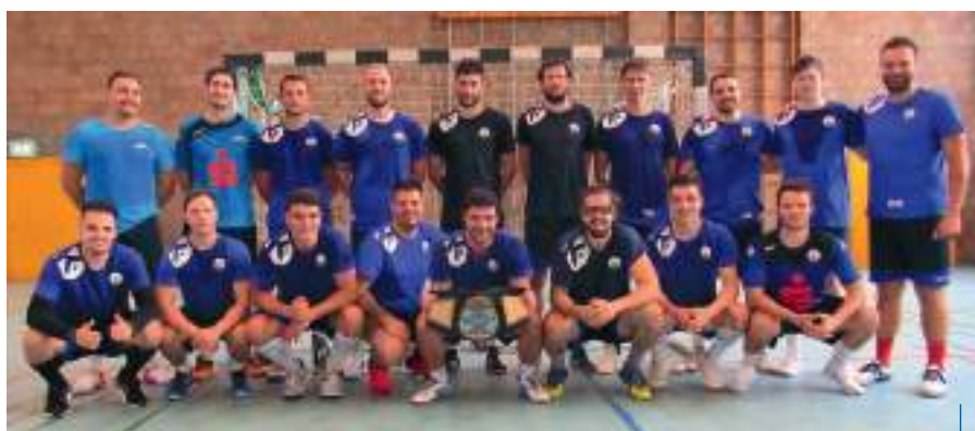
Fertig, aber glücklich, die TSB Jets nach dem Trainingslager

Das Wochenende 10. bis 12. Juli verbrachten die TSB Jets im Trainingslager in heimischer Halle. Ein Highlight war sicherlich die gemeinsame Trainingseinheit mit Kickbox-Profi Zoran Stojakovic.