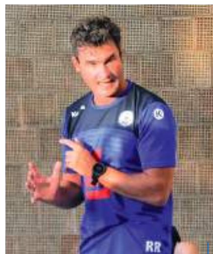
Ein Mittelfeldplatz ist auf alle Fälle machbar, dann sind wir sehr zufrieden

Ein schleichender Umbruch ist deshalb der Wunsch. „In unserer A-Jugend sind tolle Typen dabei, die uns noch viel Spaß machen werden, aber in dieser Saison noch nicht dauerhaft zur Verfügung stehen werden“, erklärt Rascher. Die Parallelen zu seiner