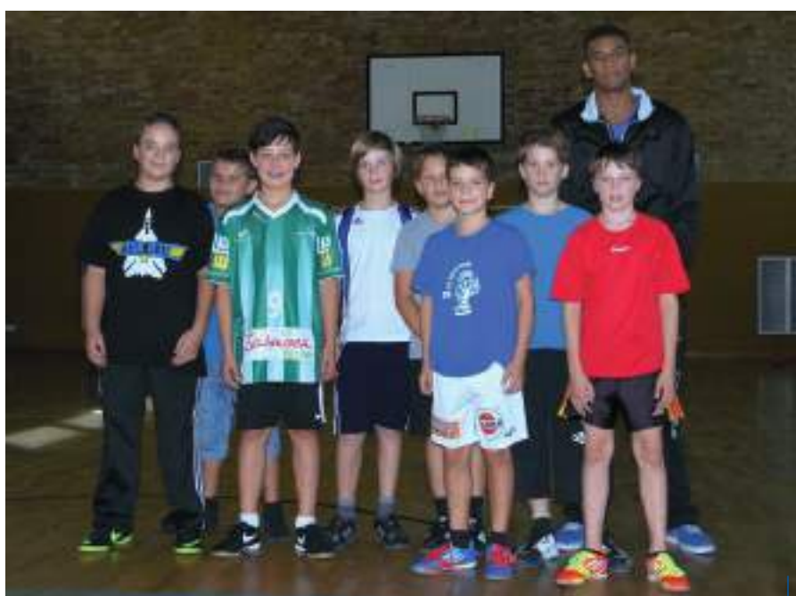
Ein Schnappschuss aus vergangenen Zeiten, wisst ihr noch wer damals FSJler war?