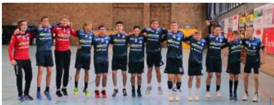
Jede Menge Erfolge gab es in letzter Zeit für unsere B-Jugend zu feiern