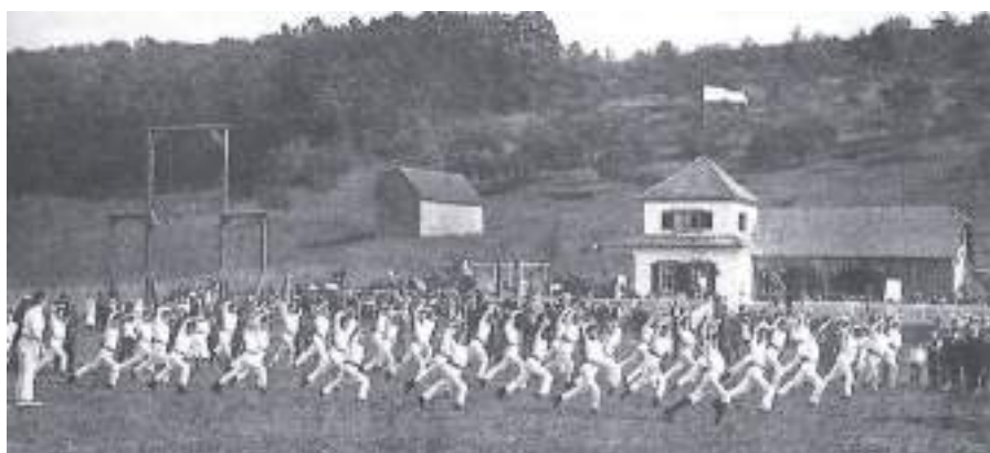
Das Turnerheim in der Buchstraße im Jahre 1913