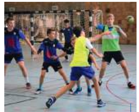
... und das Erlernte im Spiel umgesetzt

Der viel beschworene „Grützmaker-Effekt“ soll auch im zweiten Jahr anhalten. Die Ideen und Impulse des jungen Coaches sollen dazu beitragen, dass die Jets nun von Anfang an nahe heran kommen an ihr Leistungsmaximum. Der frischgebackene Abiturient, nunmehr hauptverantwortlich für die C-Jugend, hat seine eingespielte Truppe in einer schweißtreibenden Vorbereitung auf die kommenden Ziele eingeschworen. Nur fünf Akteure sind in die B-Jugend aufgerückt. „Wir haben gemeinsam ein Gebilde geschaffen, das Potenzial für die Zukunft hat“, ist