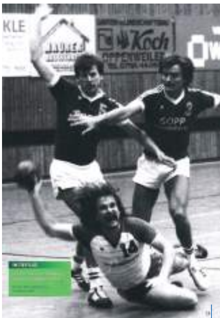
Großer Oberliga Kampf gegen Oppenweiler im Jahre 1985

Gehörig Zeit benötigten die Fusionsgespräche zwischen der TSG und dem seit 1955 existierenden SV Rehenhof. Am 7.Juni ist es so weit: Der Turn- und Sportbund Schwäbisch Gmünd 1844 e.V. wird aus der Wiege gehoben. Außerordentlich hohe Ziele setzt