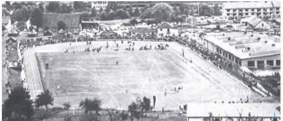
Strahlend neuer Glanz im Jahre 1960: Die frisch renovierte TG-Kampfbahn