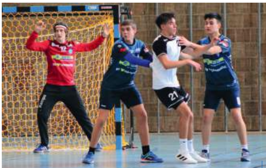
Der Angriff gewinnt Spiele, die Abwehr gewinnt Meisterschaften

Die Zeichen, dass die TSB-Youngster ihre Erfolgsgeschichte fortschreiben, stehen jedenfalls denkbar gut – wenn das Wörtchen Corona nicht wäre. Angesichts der Pandemie könnte die sportliche Herausforderung schnell wieder in den Hintergrund geraten. Im Mittelpunkt steht die Frage, ob die Partien gegen die beiden Vertreter aus dem Risikogebiet Vorarlberg – Hard und Bregenz – überhaupt stattfinden können. Gleich zu Saisonbeginn wurden alle Partien mit österreichischer Beteiligung abgesagt. Sich für ein Jugendspiel zwei Wochen in Quarantäne zu begeben, erscheint doch irrsinnig und so erwartet alle Teams in dieser „internationalen“ Württembergliga eine Reise ins Ungewisse.