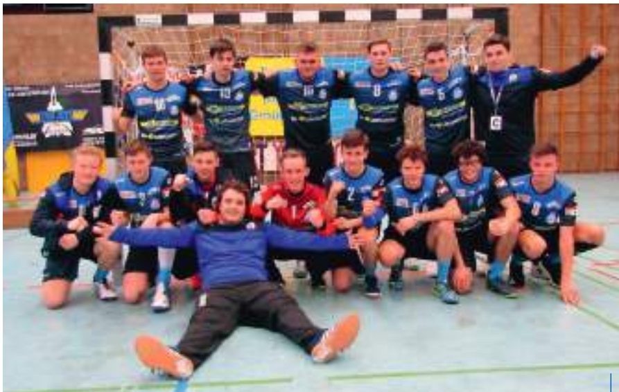
So sehen Sieger aus: Eine goldene Generation der Junior-Jets