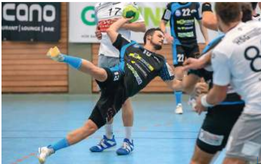
„Ich sehr gerne meinen Teil dazu bei, den Klub voranzubringen“