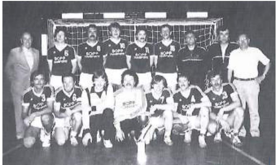
Württembergischer Pokalsieger im Jahre 1984

sich der neue Großverein, will in Fuß- und Handball die höchsten Ligen des Landes und in wenigstens vier weiteren Sportarten Bundesniveau erreichen.