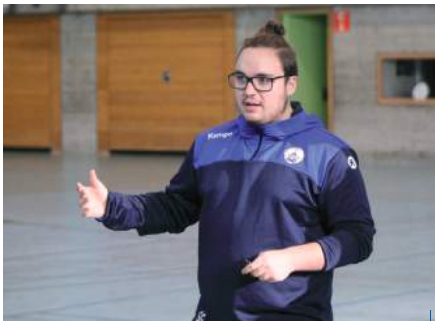
Wir wollen den Kids einfach zeigen, dass Handball auch richtig Bock machen kann

Spannend ist in diesem Hinblick insbesondere die Grundschulliga. Eine Innovation, die in der