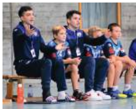
Voller Einsatz auch an der Seitenlinie