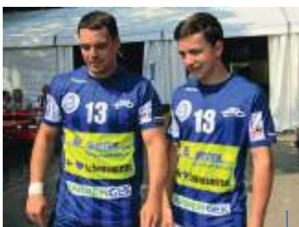
Der Yedi-Meister und sein junger Padawan