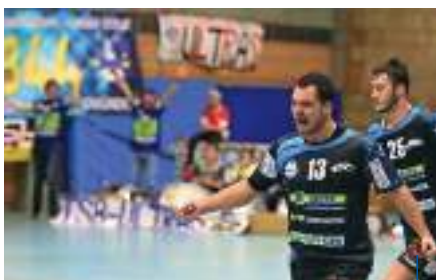
Der Mannschaftskapitän der TSB-Jets