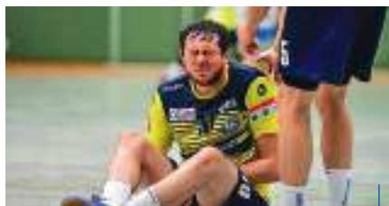
Aua, der tut weh

Platzverweise: Zwölf Rote Karten sind „Ligaspitze“